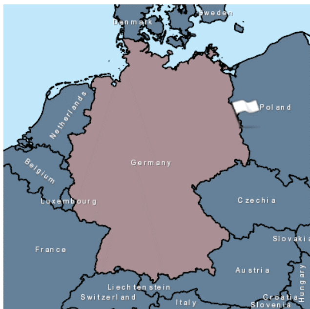
Figure 1. Localisation du premier cas de PPA en Allemagne

Alors que la situation épidémiologique en Belgique semble plutôt favorable (pas de découverte de cadavres frais infectés depuis août 2019), ce premier cas détecté en Allemagne et découvert à environ 6 km de la frontière germano-polonaise malgré les clôtures électriques nous rappelle que la situation en Europe est loin d'être contenue (figures 1 et 2). Du 31 août 2020 au 06 septembre 2020, 171 foyers ont été déclarés en Europe de l'Est dont 113 sur des sangliers sauvages non captifs. En Asie, la situation semble hors de contrôle.