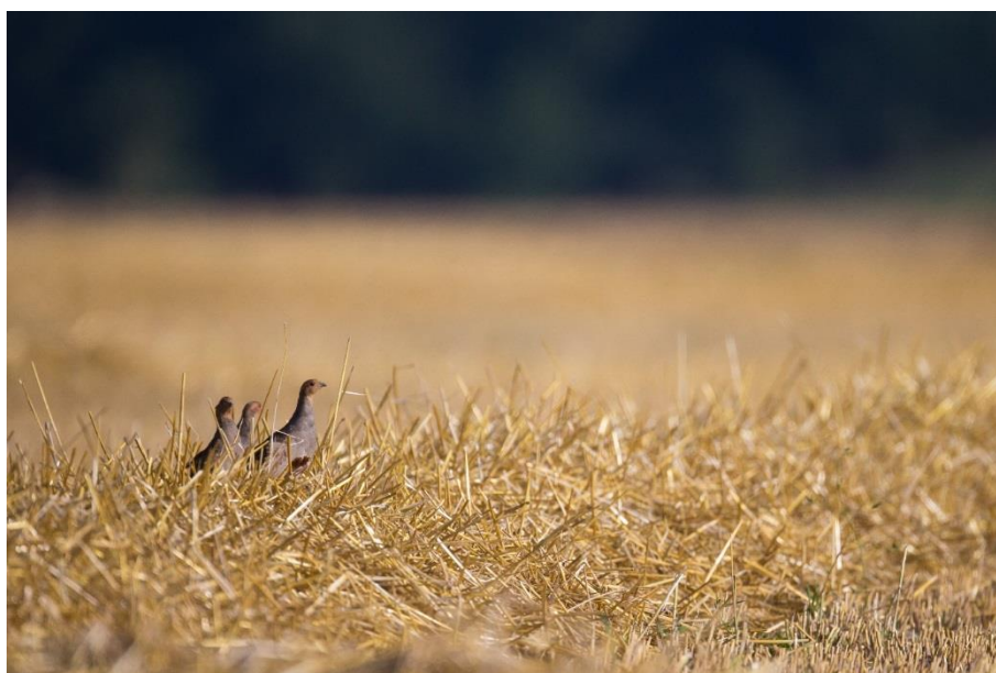
Trop d'adultes sans jeune constatés ces dernières années ...

Comme l'année dernière, malgré des conditions météo « à priori » plutôt favorables, la reproduction n'est, une nouvelle fois, pas conforme à nos attentes. Plus d'une poule sur deux n'a pas de jeune en août. Les causes restent inexplicables et le mal semble bien profond. Les lâchers de renforcement à partir de jeunes oiseaux âgés de 12 semaines menés cet été sur 15 territoires marnais sont une des solutions pour compenser cette absence de productivité. Ces compagnies sont très rapidement adoptées par des couples sauvages sans progénitures, laissant espérer une adaptation et une survie maximum. Le tout pour continuer à profiter des plaisirs de la quête de la reine des plaines !